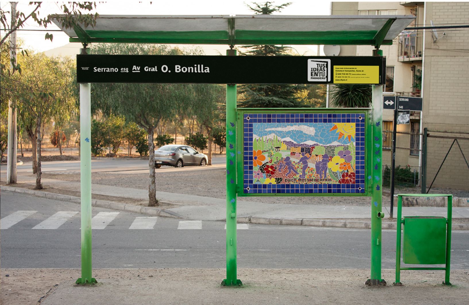
Serrano esq. Av. General O. Bonilla