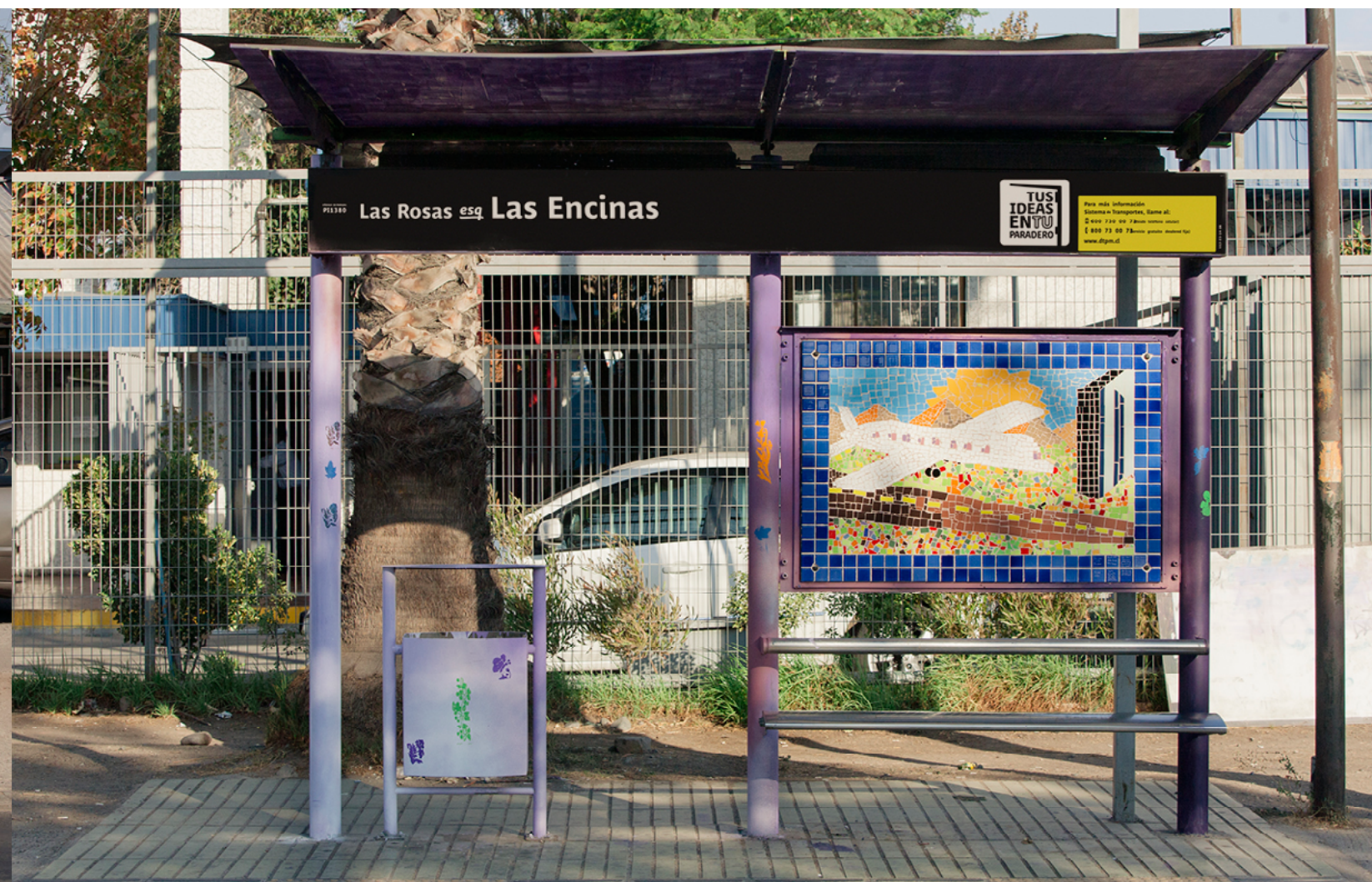
Las Rosas esq. Las Encinas