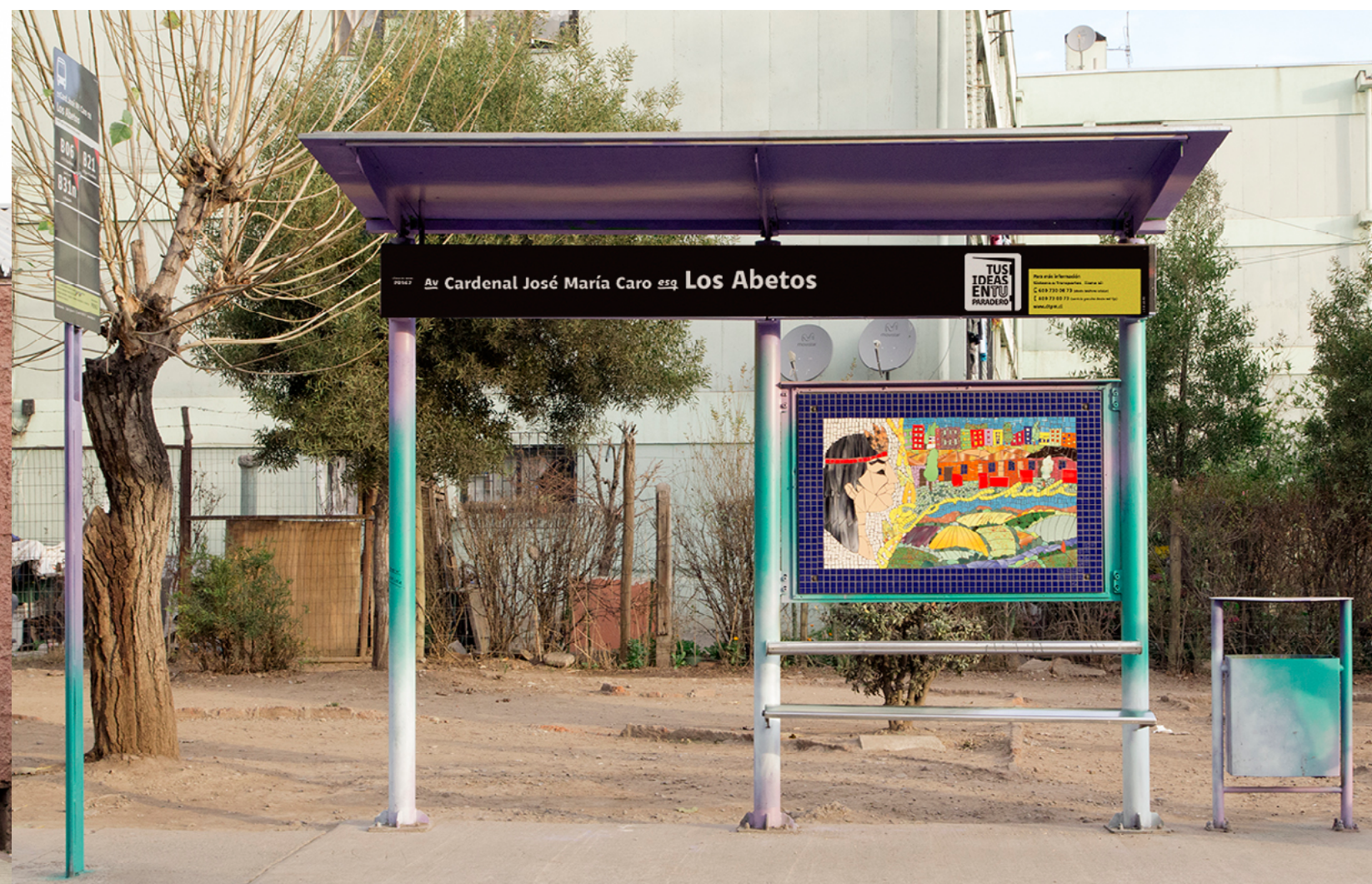
Av. Cardenal José M a Caro esq. Los Abetos