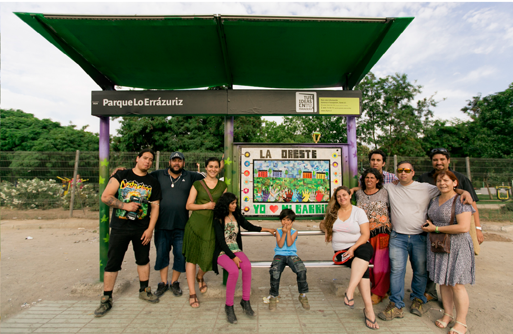
Parque Lo Errázuriz