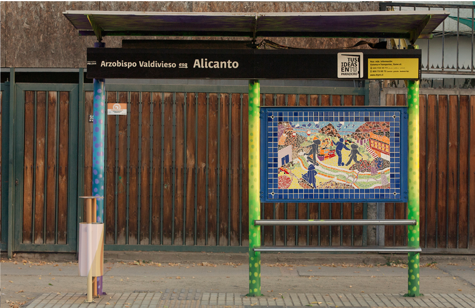
Arzobispo Valdivieso esq. Alicanto