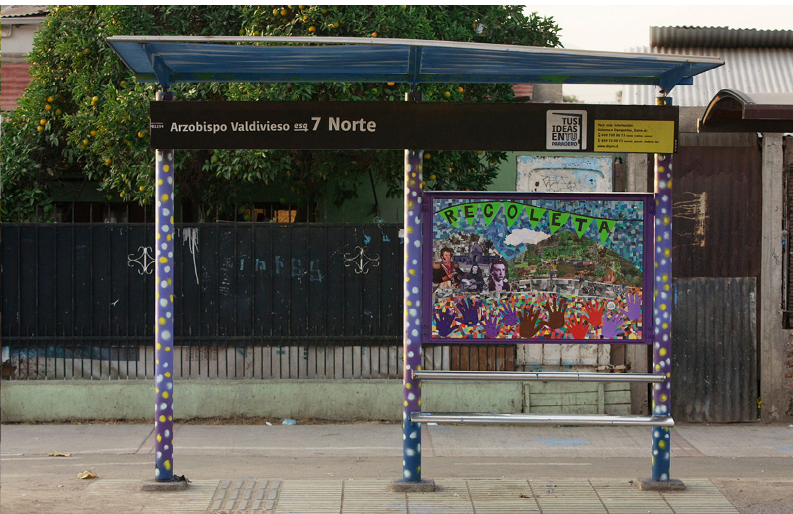
Arzobispo Valdivieso esq. 7 Norte