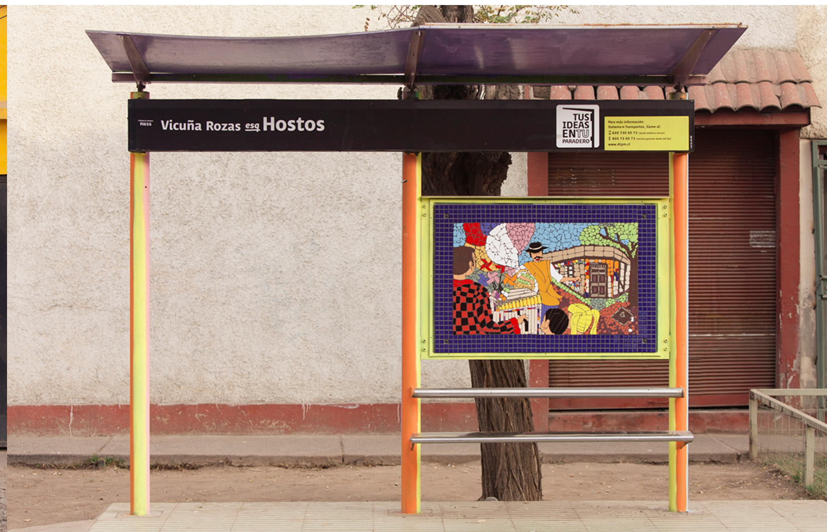
Vicuña Rozas esq. Hostos