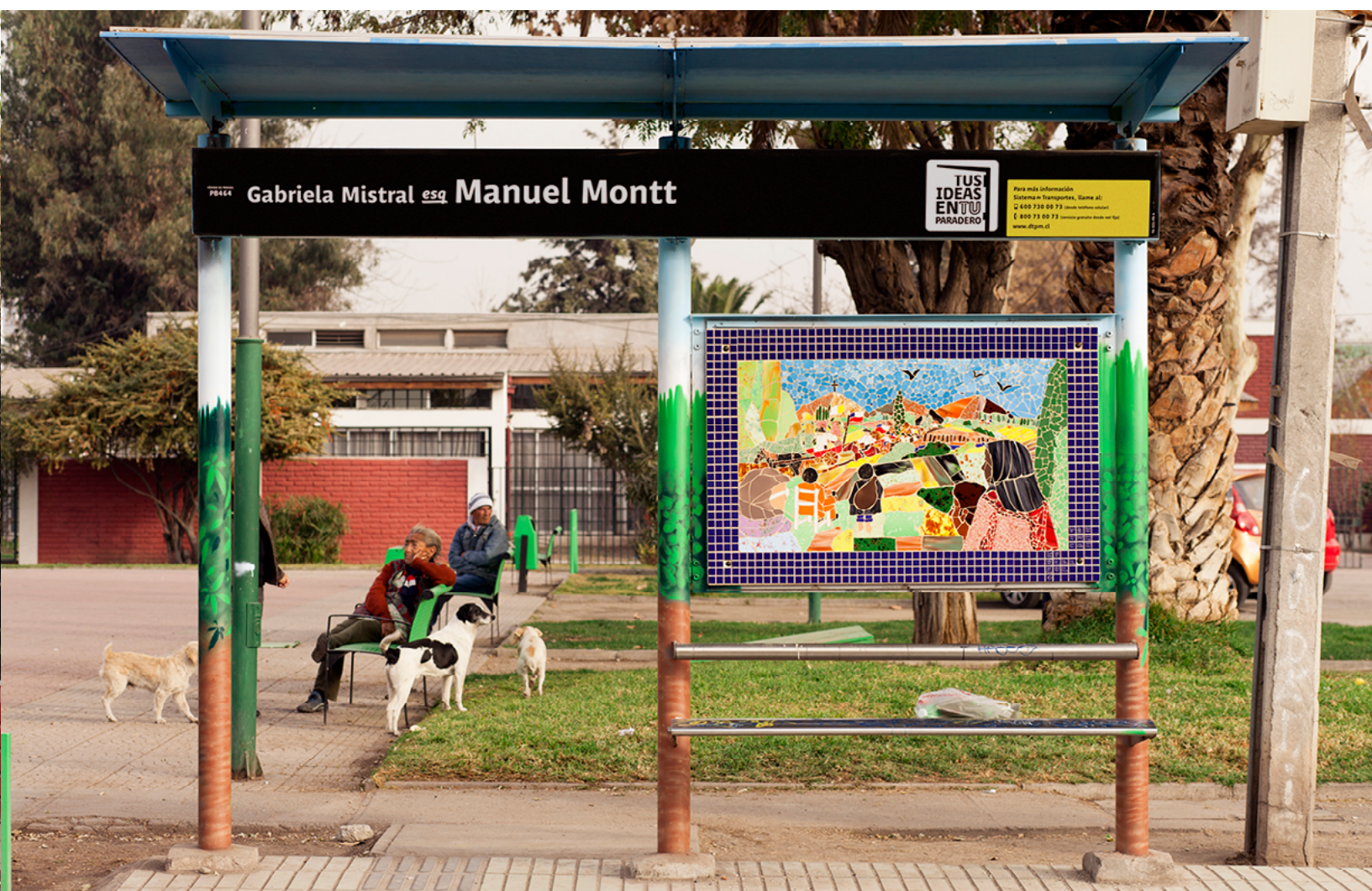
Gabriela Mistral esq. Manuel Montt