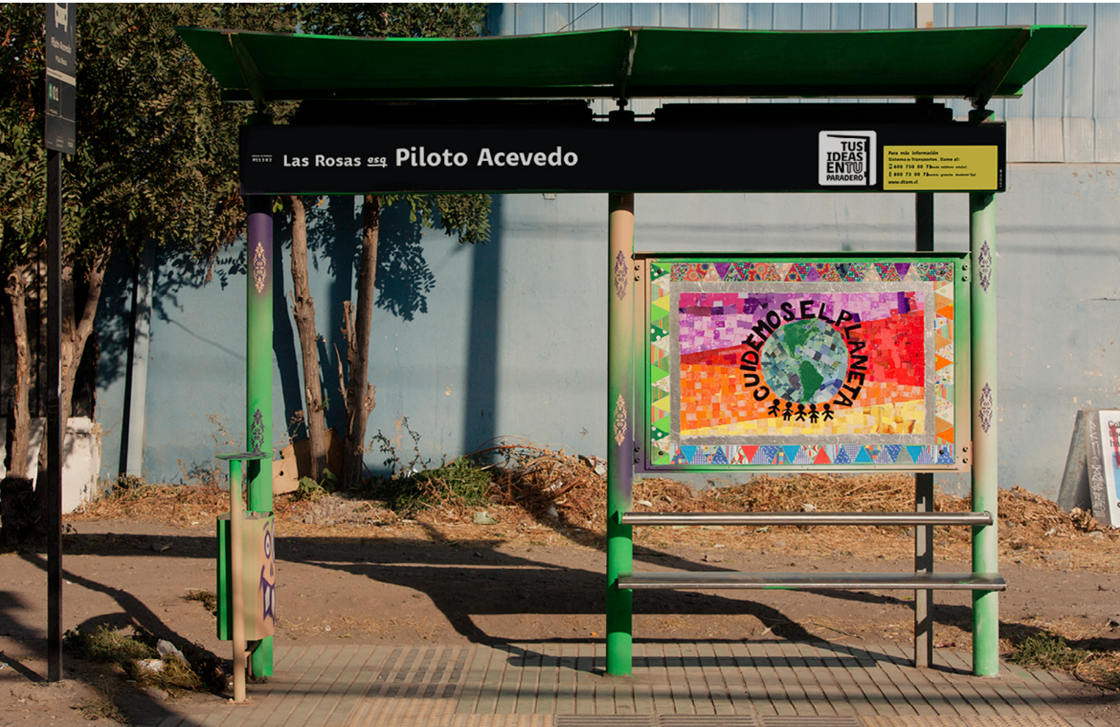
Las Rosas esq. Piloto Acevedo