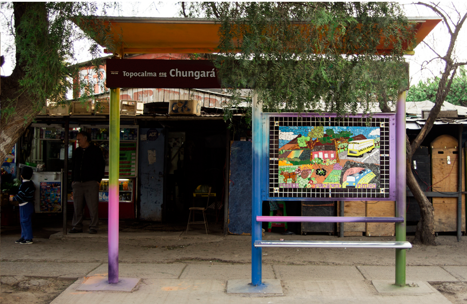
Topocalma esq. Chungará