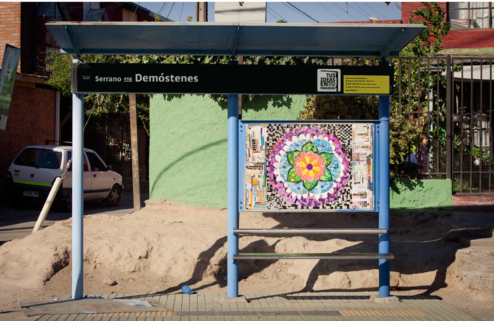
Serrano esq. Demóstenes