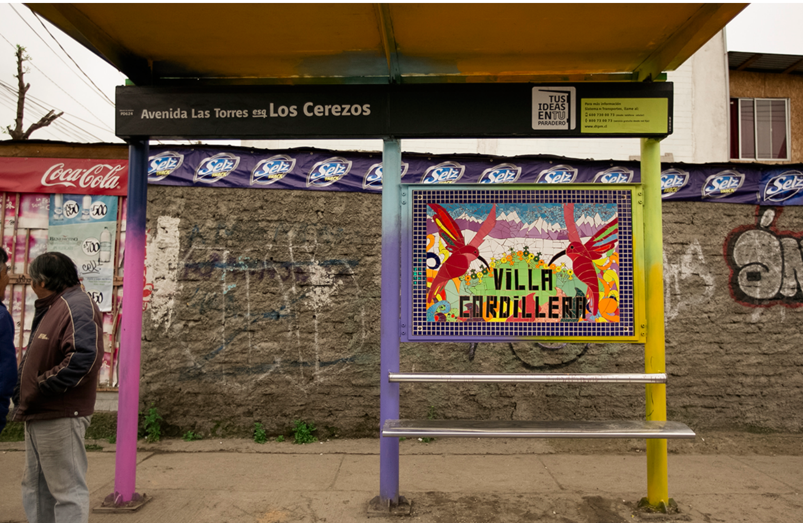
Av. Las Torres esq. Los Cerezos