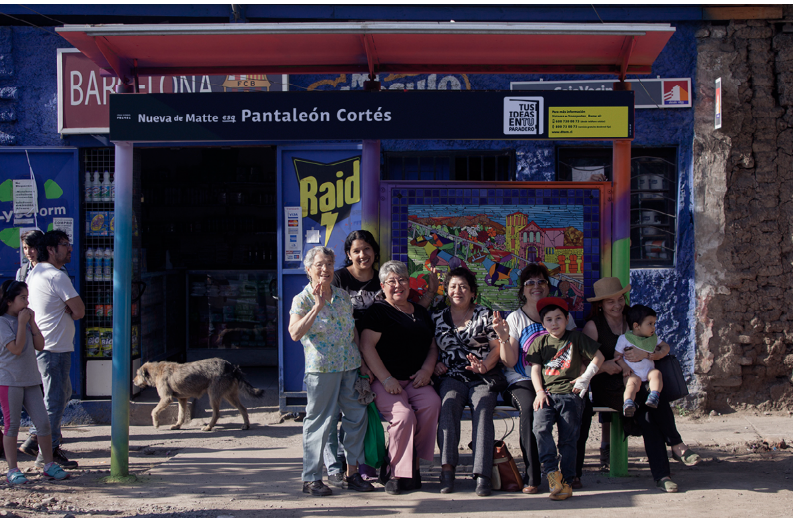
Nueva de Matte esq. Pantaleón Cortés