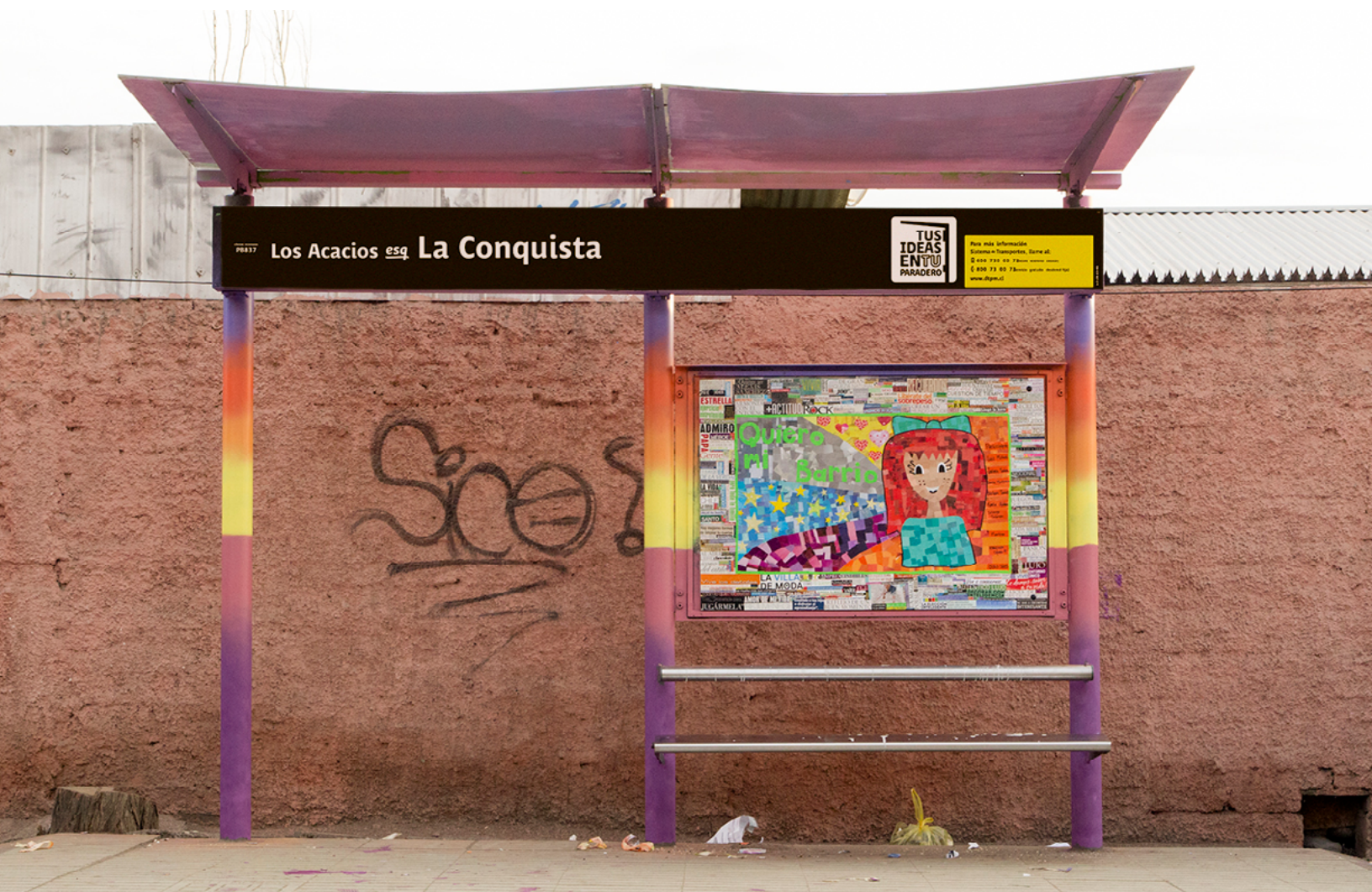
Los Acacios esq. La Conquista