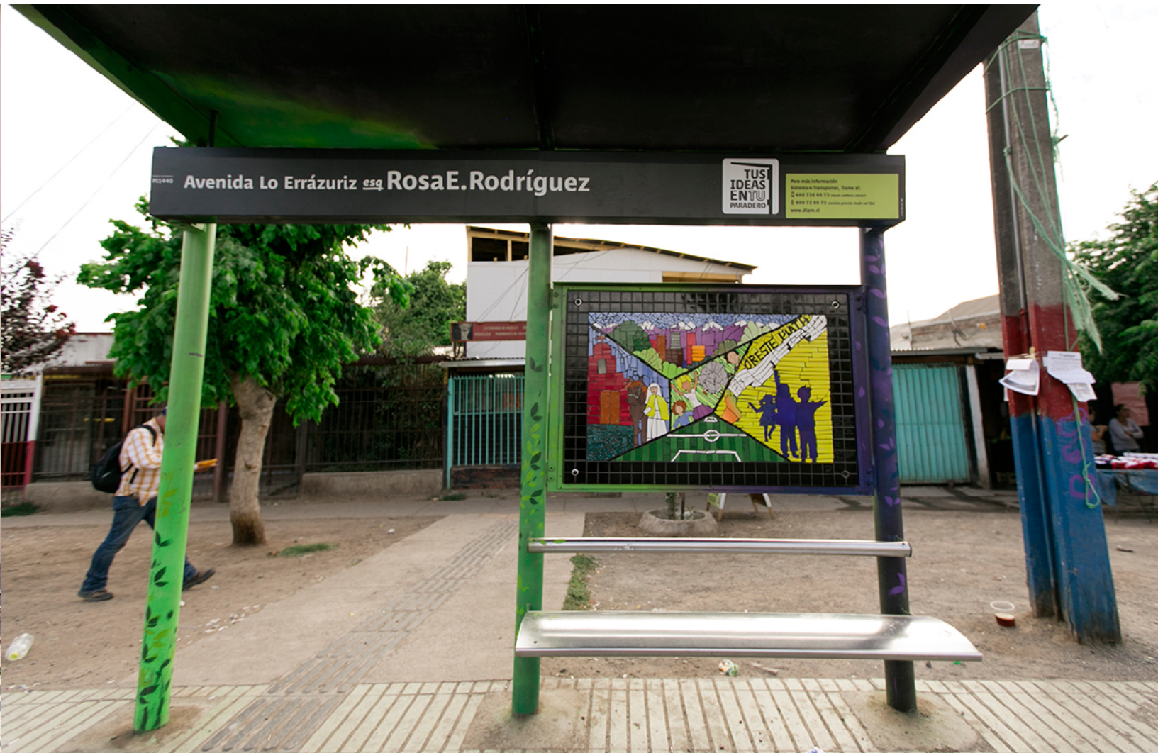
Av. Lo Errázuriz esq. Rosa E. Rodríguez