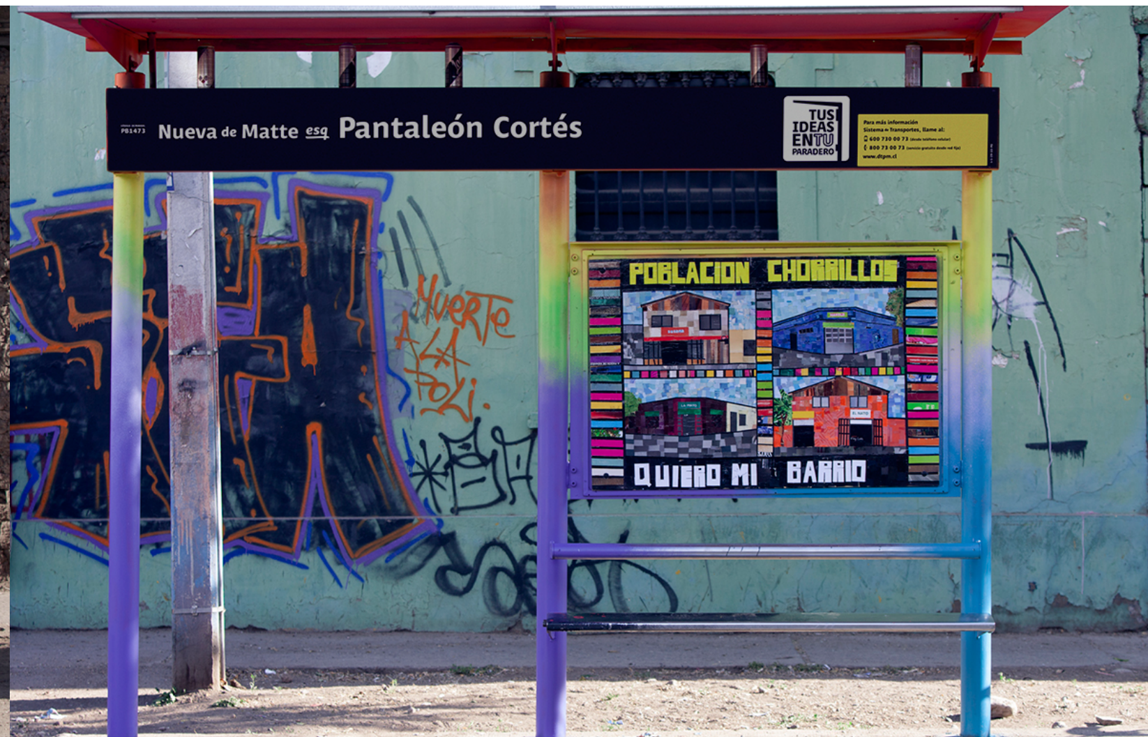
Nueva de Matte esq. Pantaleón Cortés