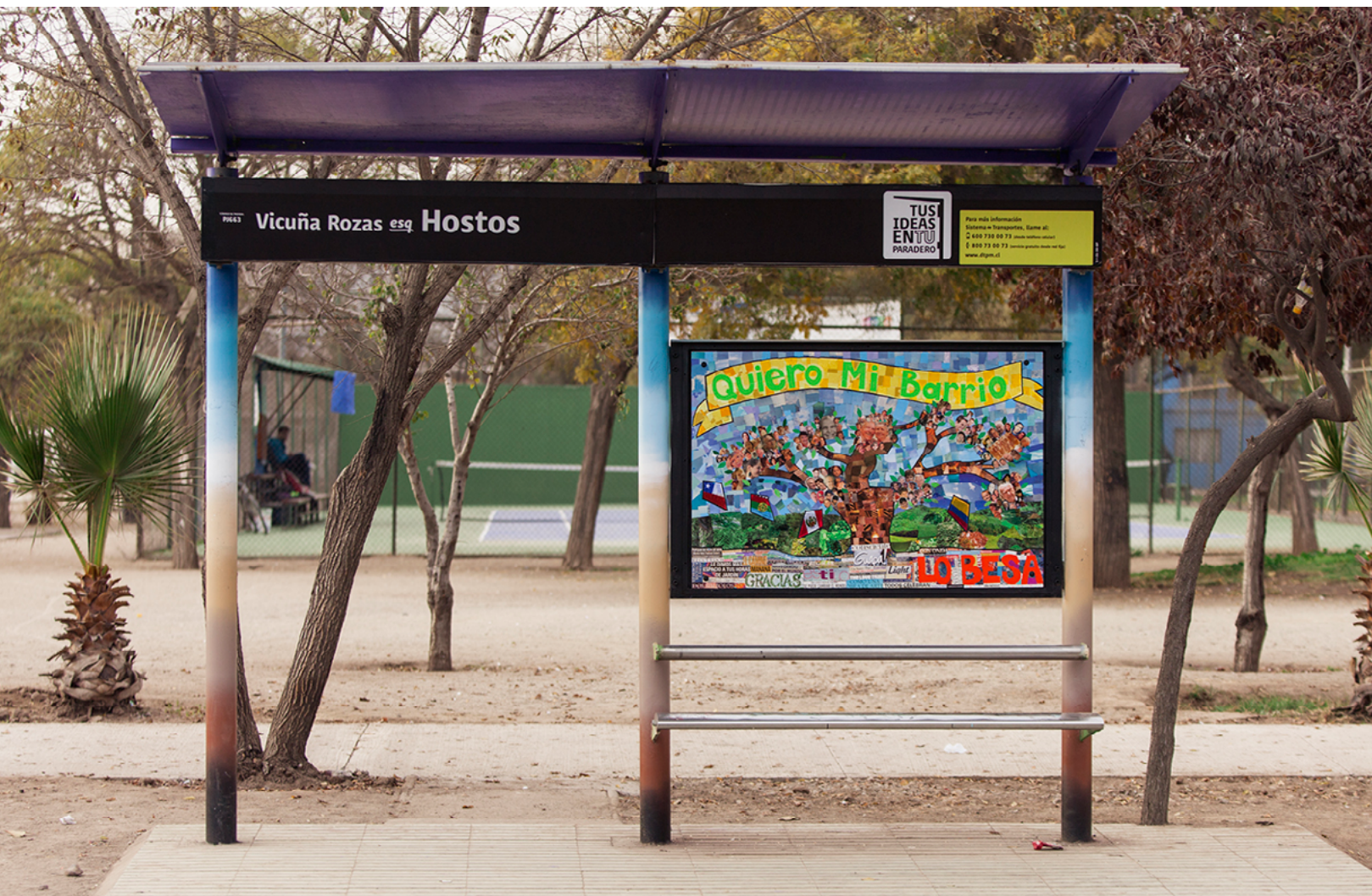
Vicuña Rozas esq. Hostos