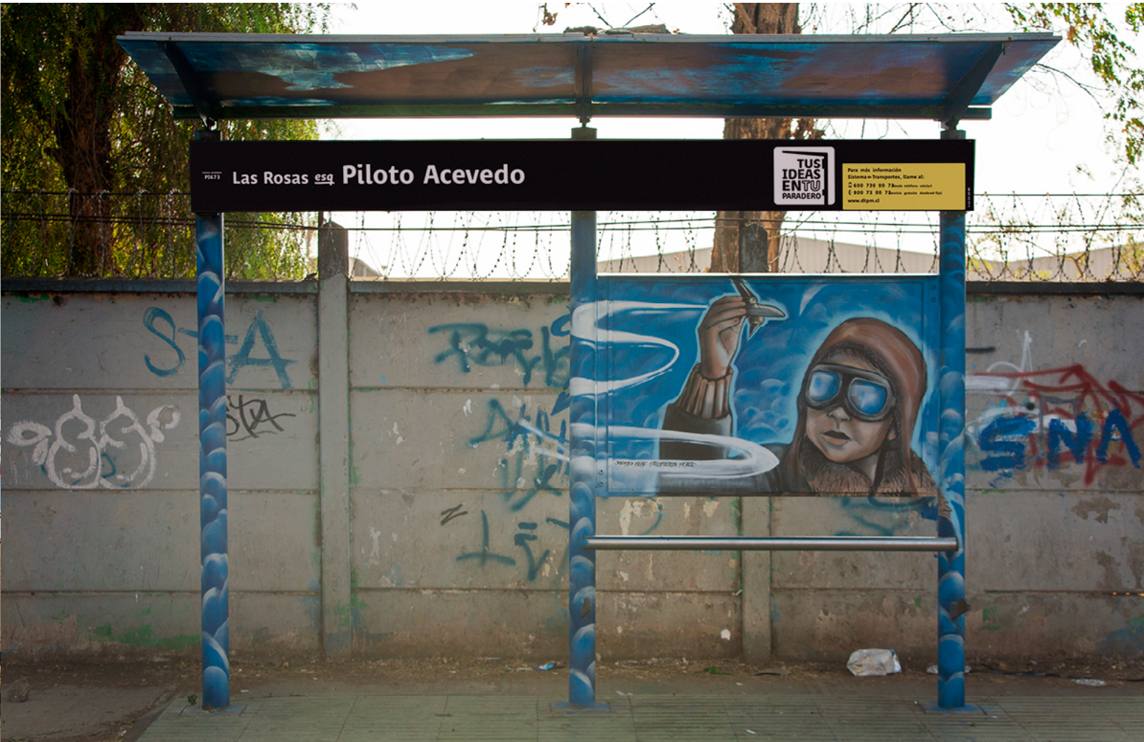
Las Rosas esq. Piloto Acevedo