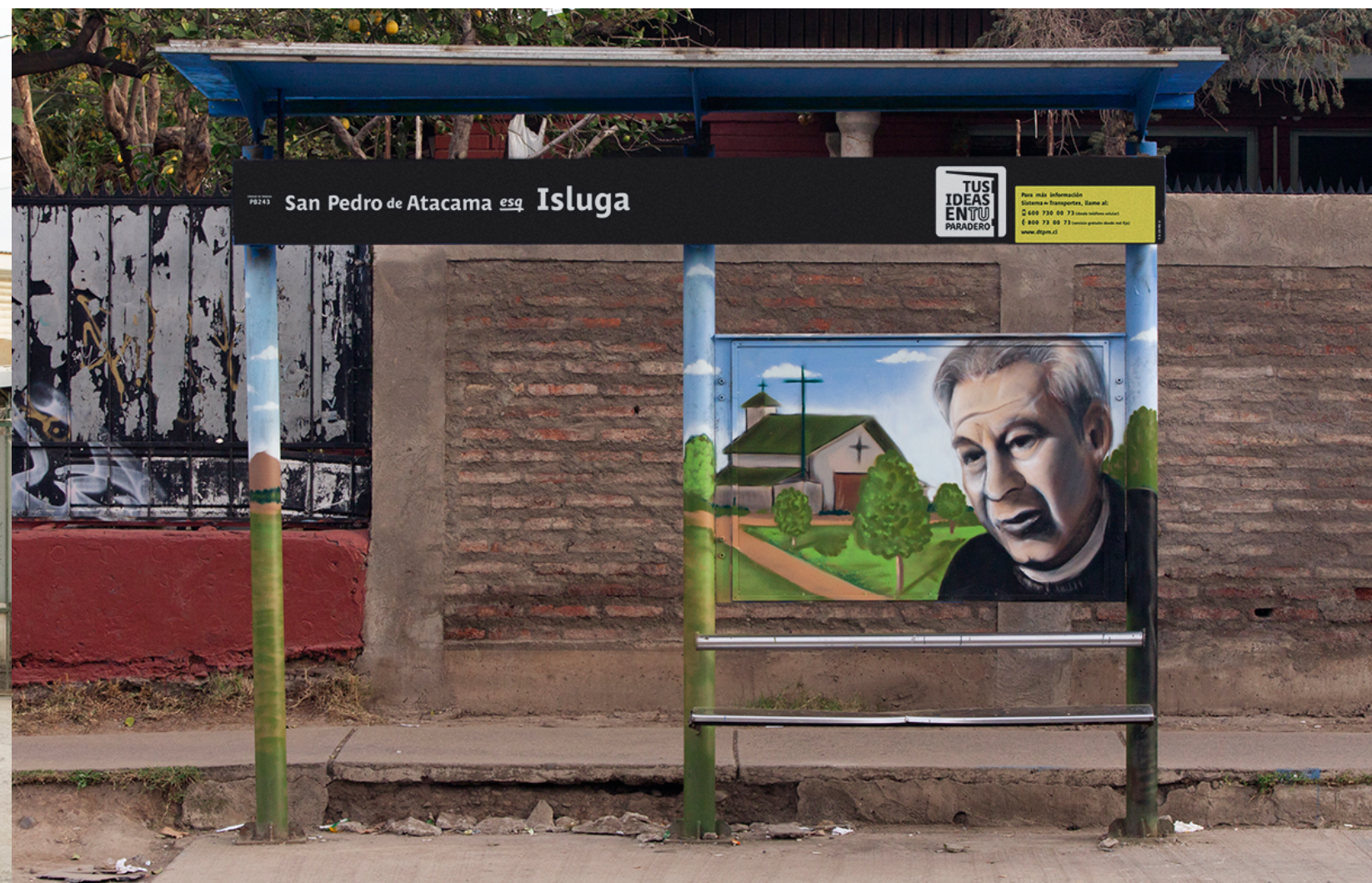
San Pedro de Atacama esq. Isluga