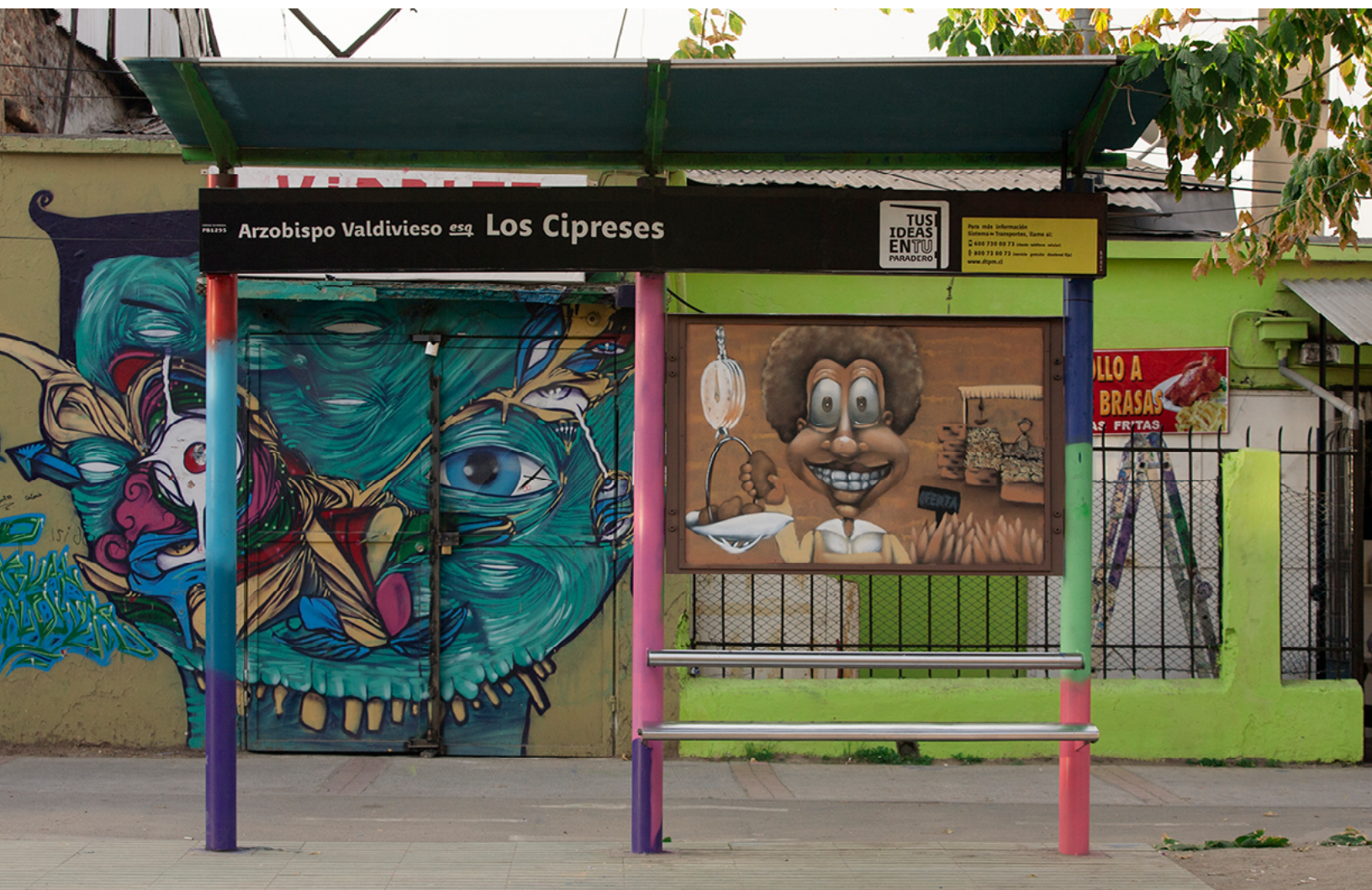
Arzobispo Valdivieso esq. Los Cipreses