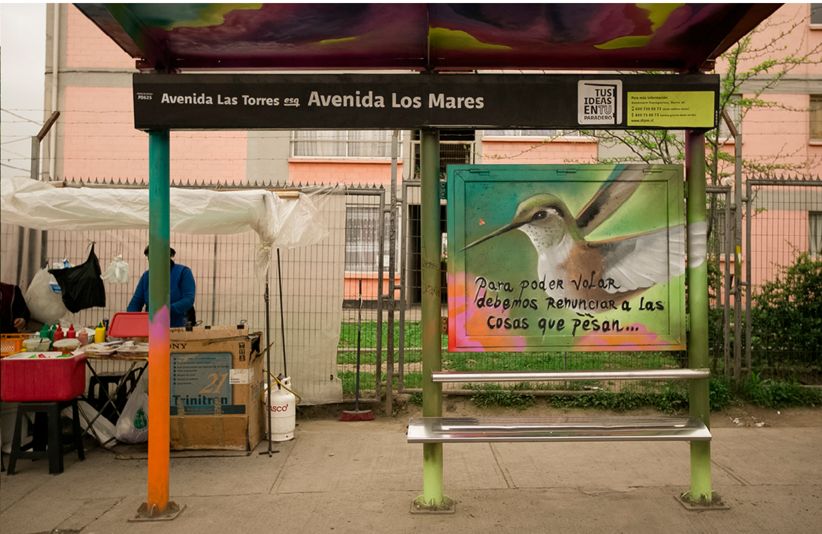
Av. Las Torres esq. Av. Los Mares