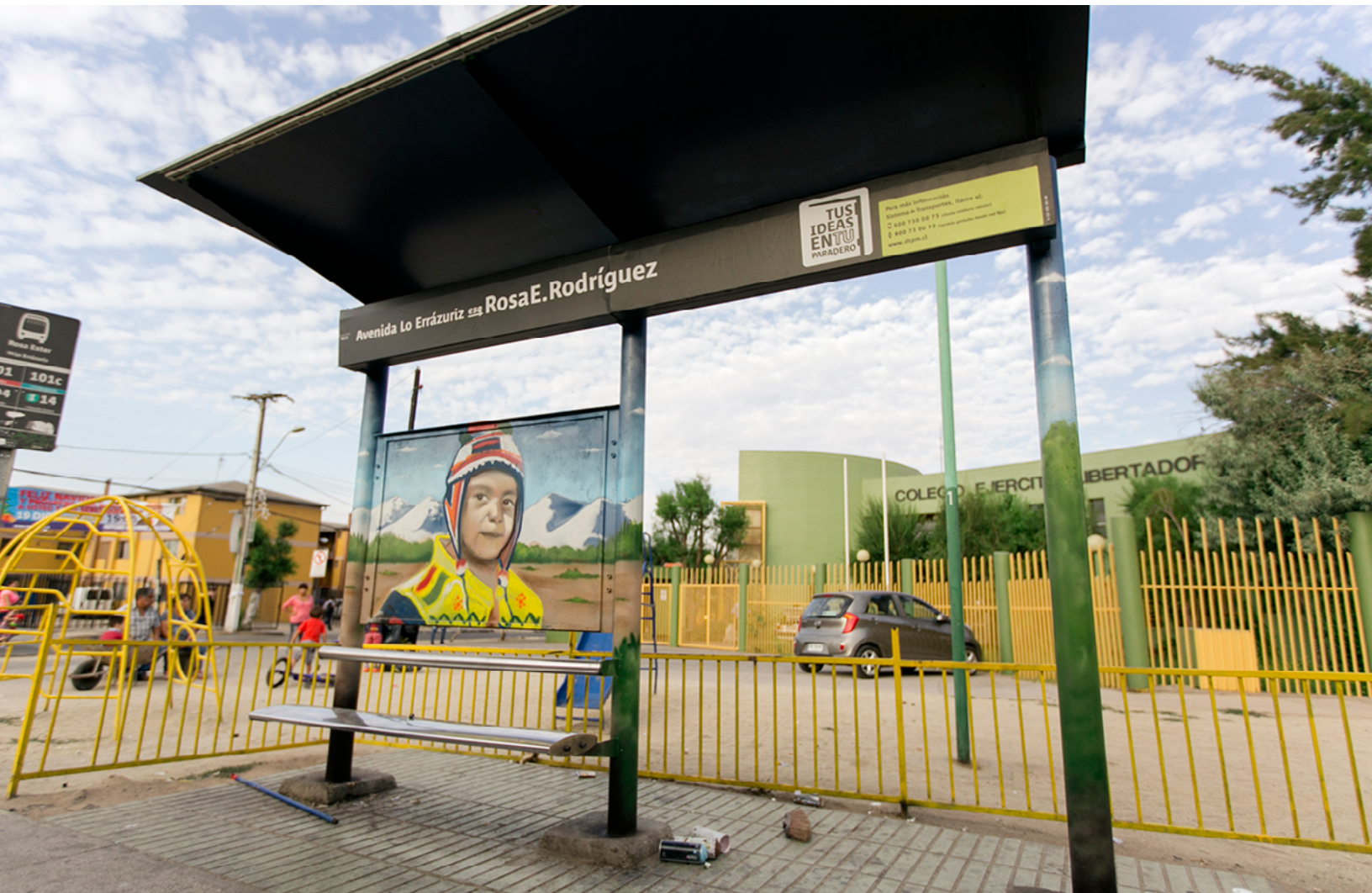
Av. Lo Errázuriz esq. Rosa E. Rodríguez