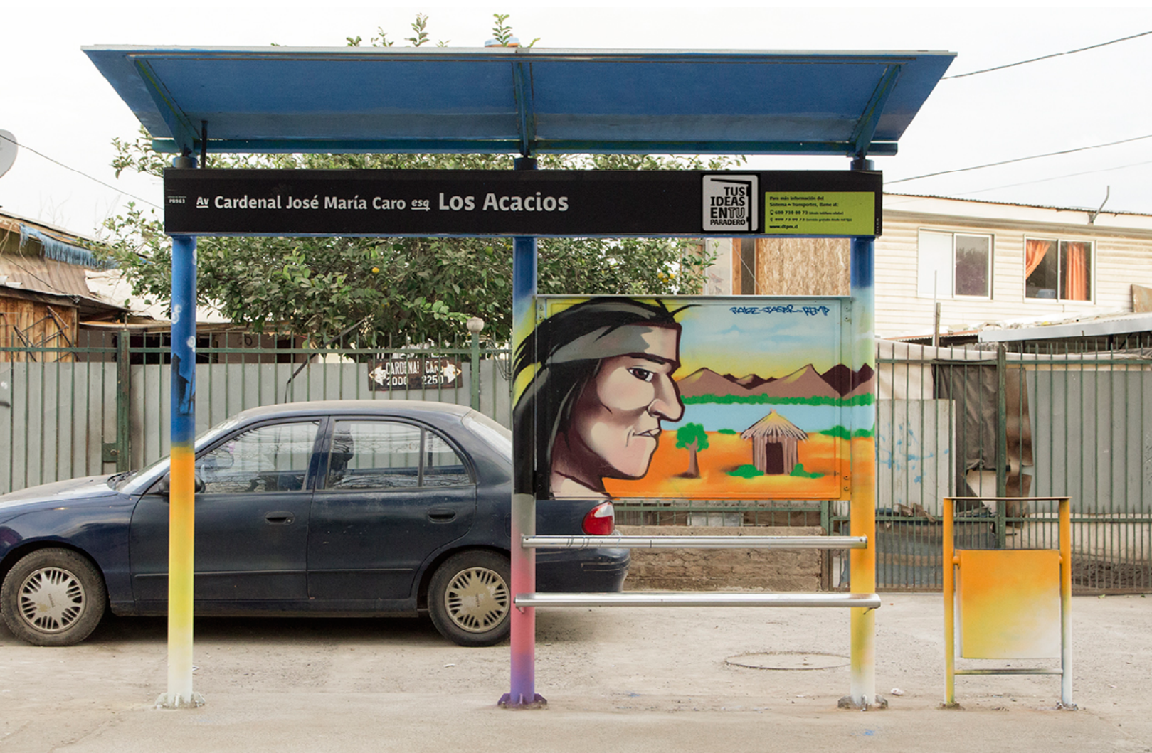
Av. Cardenal José M a Caro esq. Los Acacios