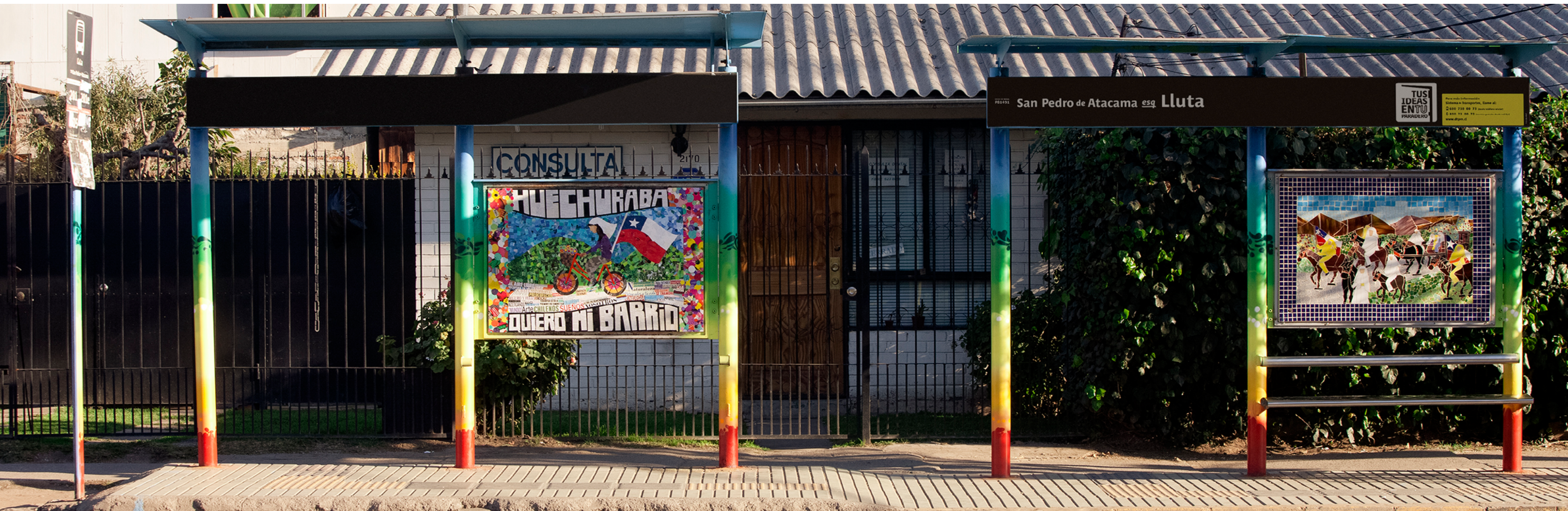
San Pedro de Atacama esq. Lluta