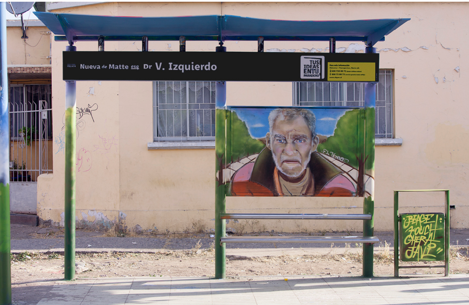
Nueva de Matte esq. Dr. V. Izquierdo