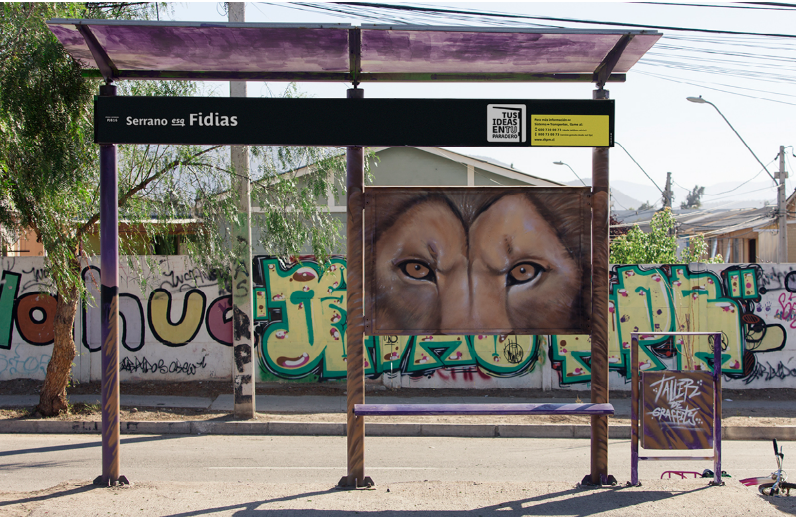
Serrano esq. Fidias