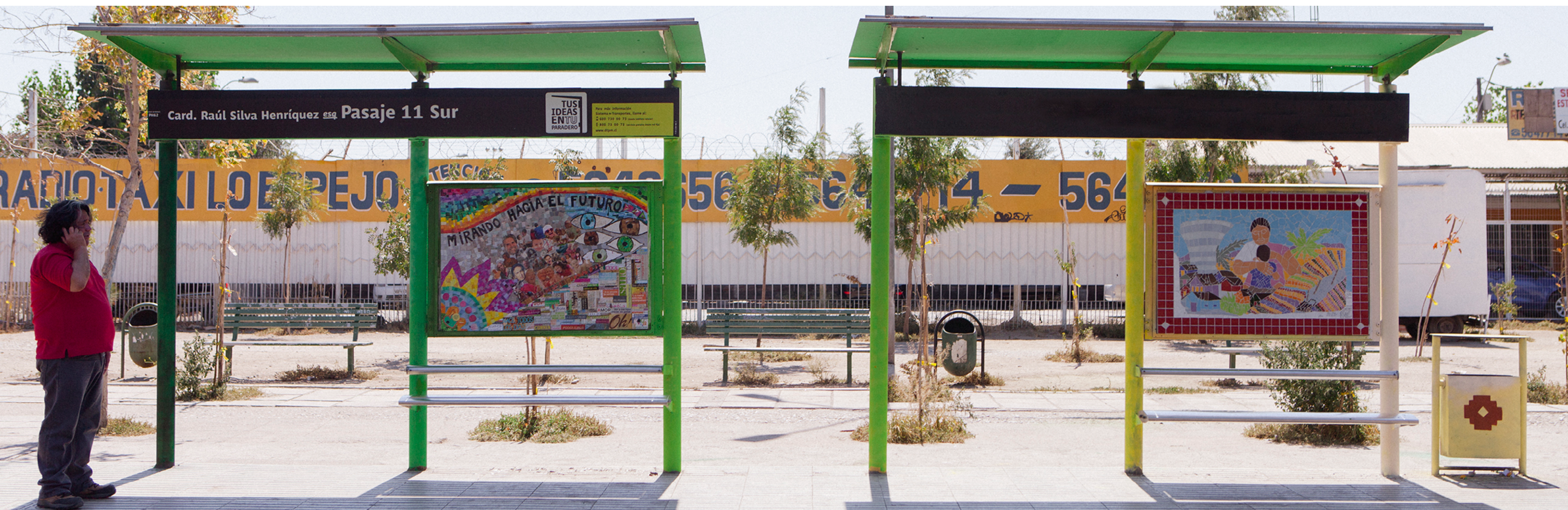
Parada 1 y 2 Cardenal Raúl Silva Henríquez esq. Pasaje 11 Sur