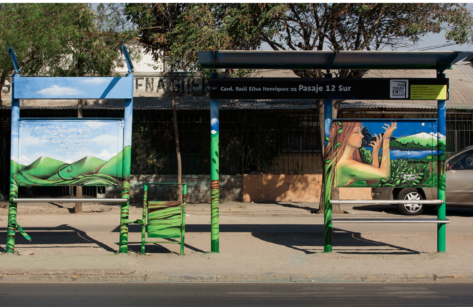
Cardenal Raúl Silva Henríquez esq. Pasaje 12 Sur