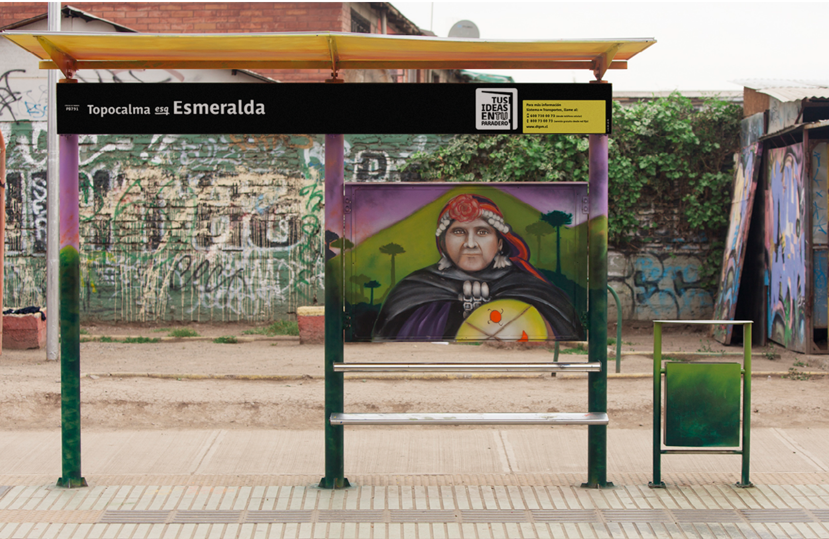
Topocalma esq. Esmeralda