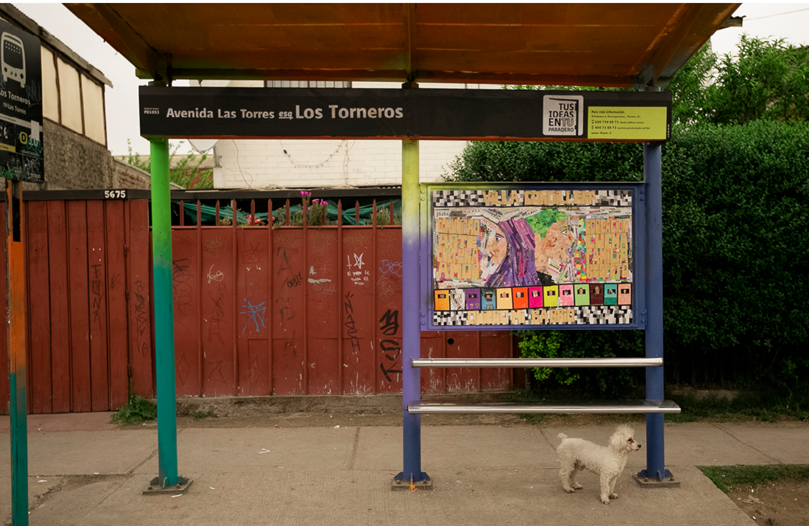
Av. Las Torres esq. Los Torneros